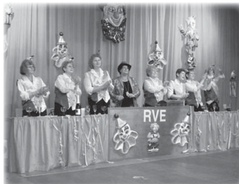
Närrischer Worschtabend 2007