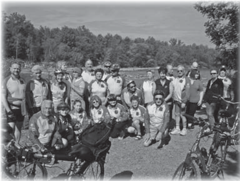
Die Radwanderer am Bodensee 2008