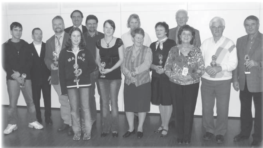
Die Vereinsmeister im Radwandern und Radtourenfahren 2007

bei einer Radwanderung zur Radveranstaltung in Gau-Algesheim im September 2007.