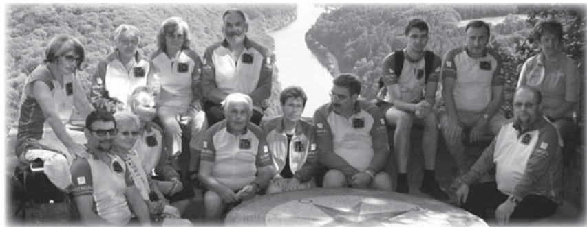
Die Radwanderer an der Saarschleife bei Mettlach 2009

Größtes Ereignis war die Radwanderfahrt an Saar und Mosel vom 11.-14.6.2010, bei der vier schöne Touren an der Mosel, an der Sauer entlang nach Luxemburg, das Kylltal hinab zur Mosel und zur Saarschleife bei Mettlach gefahren wurden. Auch lukullische und kulturelle Genüsse kamen