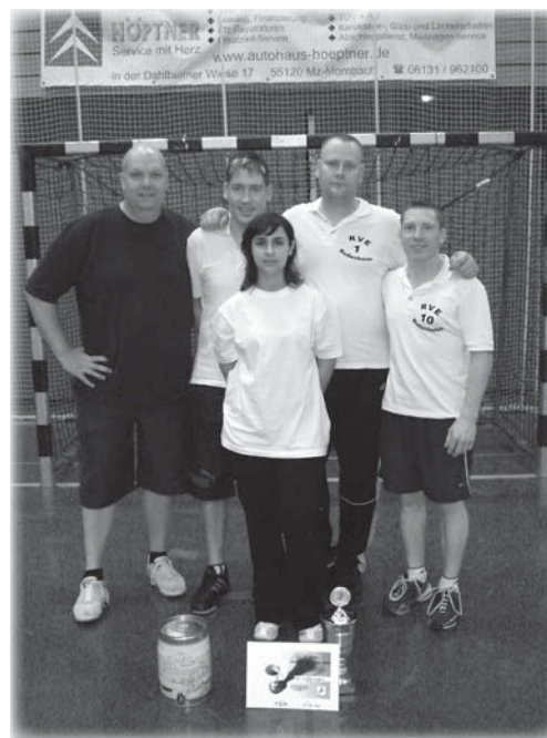
Die „Luftpumpen“ 2009