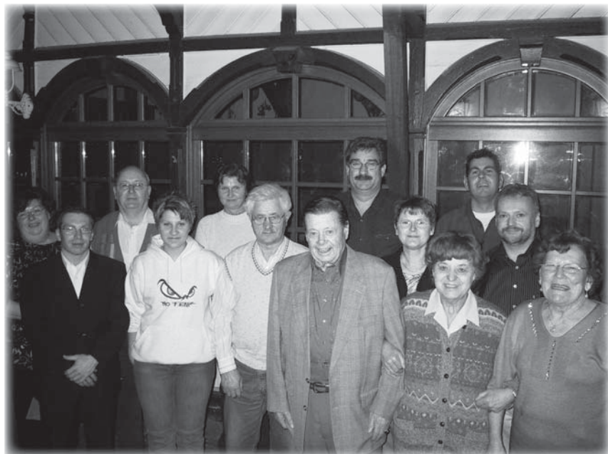
Der Vorstand 2005

Die Ehrengilde unternahm wieder zwei Fahrten. Die Tagesfahrt ging nach Völklingen und Mettlach, die 7-Tages-Fahrt nach Wernigerode im Harz.